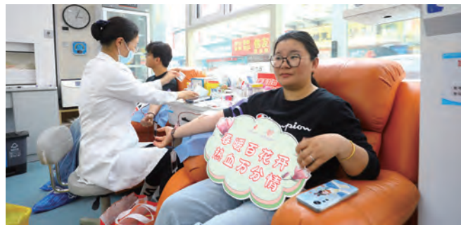
为弘扬无私奉献精神,助力公益事业,5月16日下午,台北(华茂)公司积极组织员工前往连云港市爱心献血屋,开展“热血献初心 奉献担使命”无偿献血活动。通过公司内部动员宣传,员工们踊跃参与,共有30余名员工参与献血,累计献血量达10000毫升,以实际行动诠释国企的社会责任与人文关怀。(宋雯雯)

清风护航促廉“果”。本次活动形成“四个一”廉洁成果:一份《家风倡议书》明确准则,一册《廉语集》夯实根基,一份《公约书》强化约束,一封《未来信》寄托期许,推动家风“软文化”转化为发展“硬支撑”。通过构建“家庭防腐—企业倡廉—国际链网”三层廉洁生态,实现家企清风共融,为打造阳光供应链注入持久动能。(赵超)