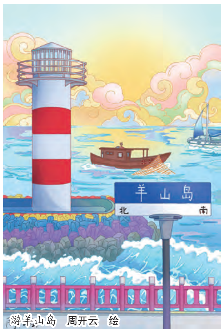
游羊山岛 周开云 绘

这就是小草的一生,平凡却坚韧,渺小却伟大,它们年复一年地生长,用生命的绿色告诉我们:保护环境,从珍惜每一株小草开始;爱护地球,从倾听每一个微小生命的声音开始。让我们携起手来,共同守护这片充满生机的绿色,让地球永远充满希望的色彩。