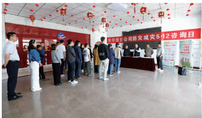
5月12日,徐圩投资公司多片区开展5.12防灾减灾宣传日活动,通过设立展台、展板、发放宣传页、避灾实用手册和现场有奖问答等形式与职工进行交流,职工在一问一答中学习了自然灾害科普知识和防范应对措施,进一步增强了企业职工防灾减灾意识。(陈蓓蓓)